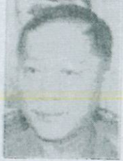
พล.ต.อ.อดุลย์ แสงสิงแก้ว